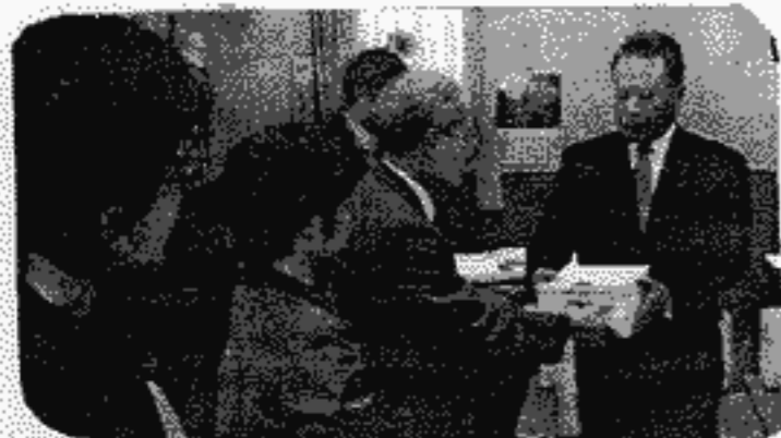
議長皆さんの意に添えるような結論が出ればいいですね