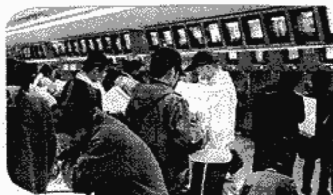
宝くじ売り場のようなものではない。昨年11月29日(南條日・高松・高松駅)も...

これに対し市長は、従来のものでなく、平成10年の基本方針を受けて、設置された津山と比較すべきと言った。心配がある場合は申