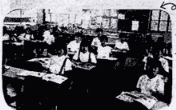
金浦小24名のクラス

文部科学省は、教科などに応じた20人程度の「少人数指導」などを推進してきた。調査によると学習面では少人数学級と少人数指導の評価はほとんど変わらないが、大きく違ったのは生活面。「不登校、いじめが減少したとは思わない。」と応えた学校が中学校で57%、小学校で36%に上る。少人数指導では、「教師間の打ち合わせや教材準備の時間が確保できない」と応えた学校が70%。