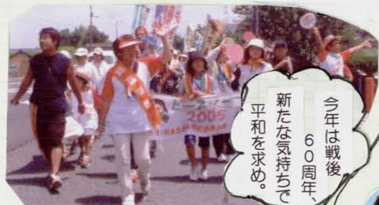
今年60周年、 新たな気持ちで 平和を求め。