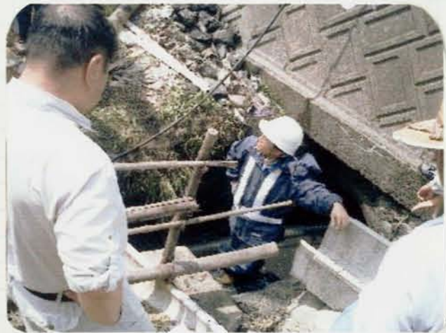
ヘドロがいっぱいじゃー。これじゃー流れん。