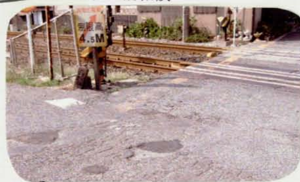
応急処置。後日本格修理。