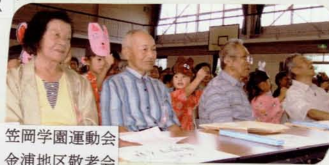
9/17 笠岡学園運動会 9/18 金浦地区敬老会