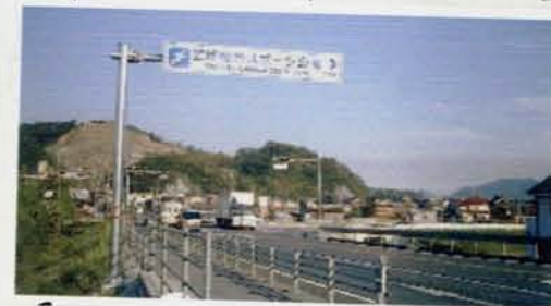
アグリスポーツ公園こちら