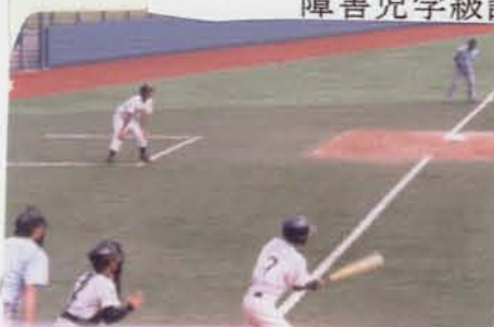
惜しい！ 来年は優勝！！